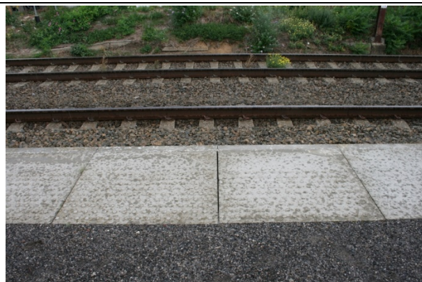
Présence de dalles podotactiles