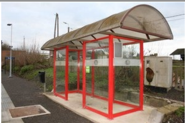
Abris sur les quais