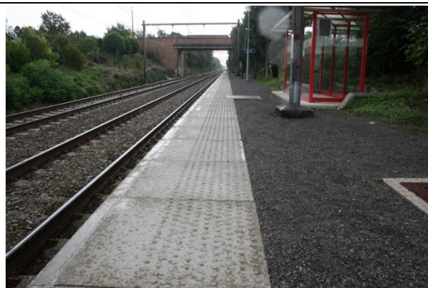
Revêtement des quais