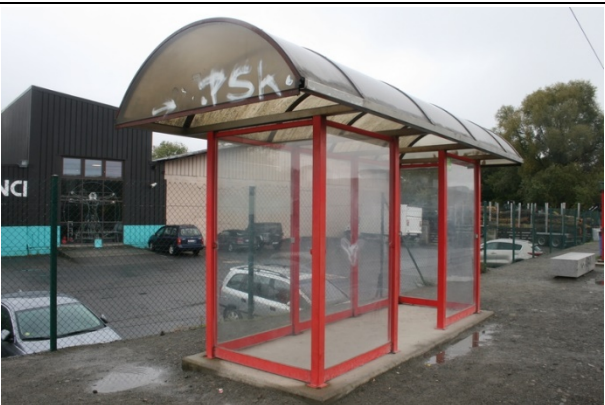
Abris sur les quais