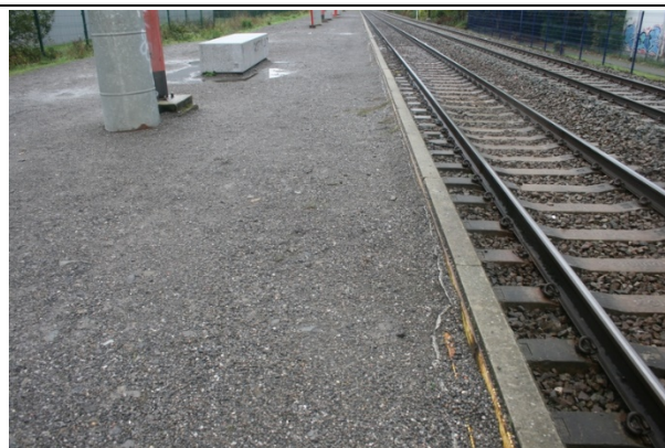
Revêtement des quais