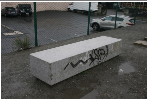
Sièges sur les quais