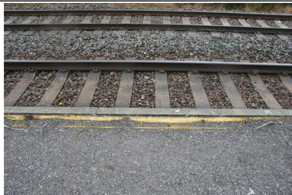
Absence de dalles podotactiles