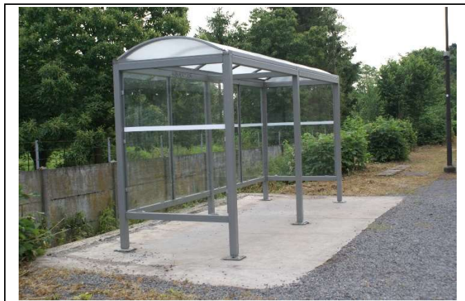
Quelques sièges sur les quais.