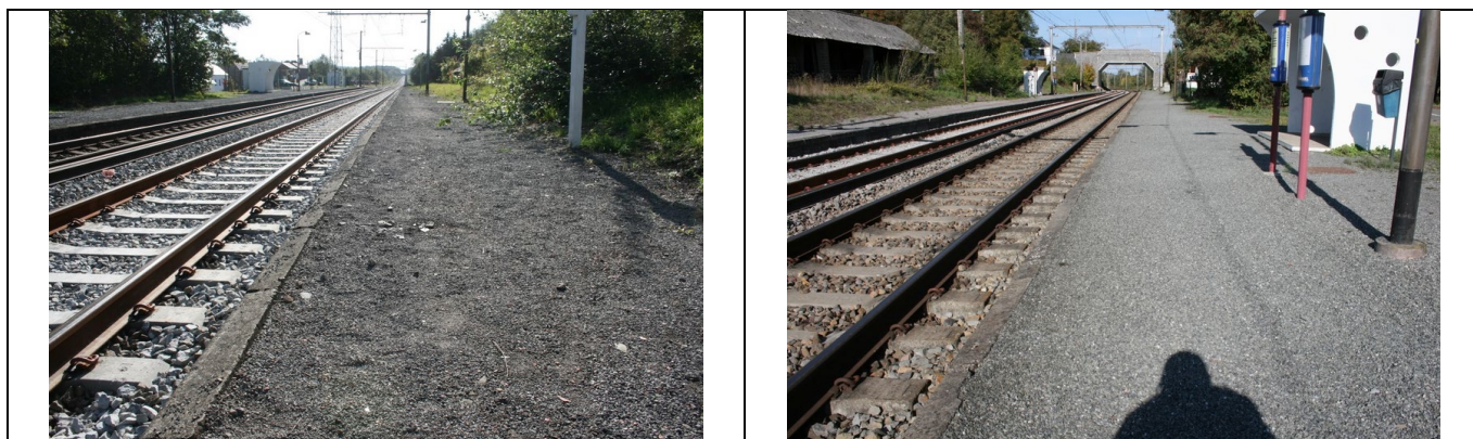
Revêtement des quais