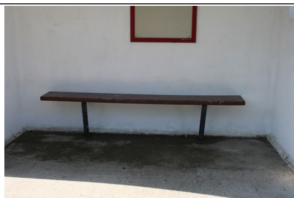
Bancs dans les abris