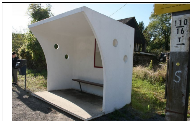
Abris sur les quais