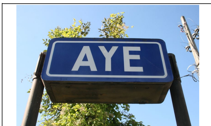
Panneaux sur les quais