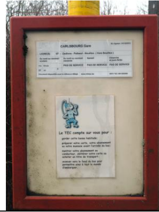
Un horaire de passage pour le moins modeste