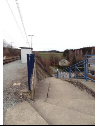
En haut de cet escalier...