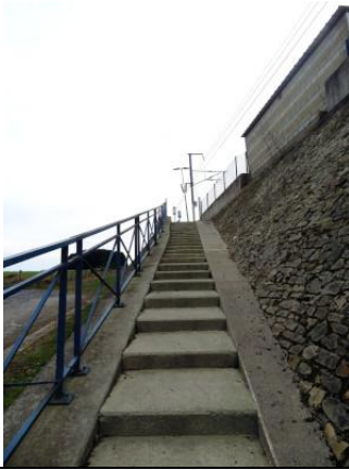
Le long escalier, en très bon état, menant à la voie 2