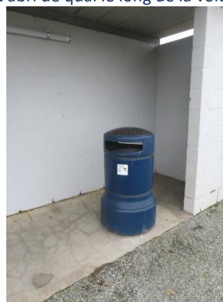
Unique poubelle le long de la voie 1