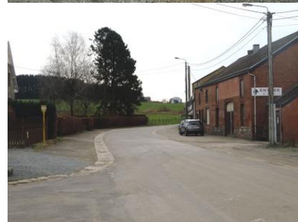
Arrêt de bus « Carlsbourg Gare » au coin formé par l'avenue Arthur Tagnon et la rue René Hanchir