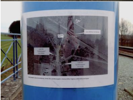
Sur une valve de l'ancien type, à la voie 2, on trouve un plan indiquant l'emplacement des arrêts de bus