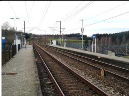
Vue d'ensemble prise de la voie 1 côté Paliseul