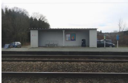
L'abri de quai le long de la voie 1