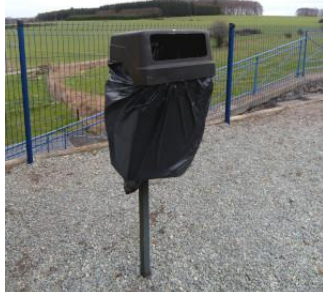
Unique poubelle le long de la voie 2