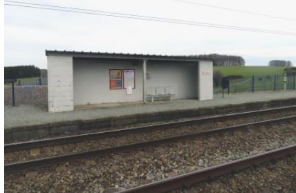
L'abri de quai le long de la voie 2