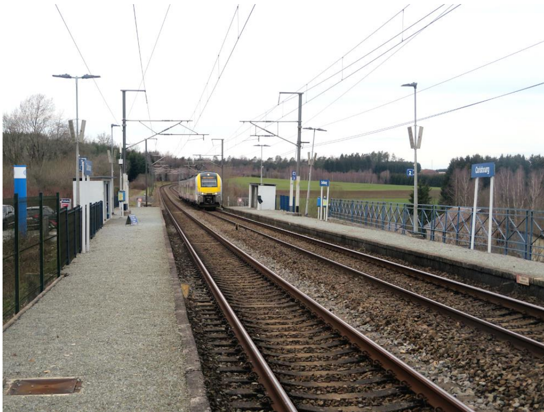
[Arrivée en gare de Carlsbourg de la Desiro 08542 assurant le train L6061 à destination de Libramont via Bertrix le 17 mars 2023]

Les installations du point d'arrêt de Carlsbourg remplissent leur rôle avec satisfaction. Dans un coin du pays aux accents très ruraux, le nombre de voyageurs y embarquant reste limité. Les comptages 2022 de la SNCB, dont nous venons de recevoir une copie, suggèrent toutefois une augmentation appréciable de ce nombre depuis 2019 (62 montées au lieu de 44) – et on se souviendra que, habituellement réalisés en automne, ces comptages ne tiennent pas compte des variations – parfois importantes – liées au caractère touristique des lieux où sont implantés les points d'arrêt.