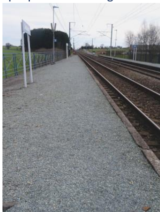
Revêtement en gravier sur toute la longueur des quais