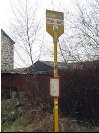
Plaque de l'arrêt de bus « Carlsbourg Gare »