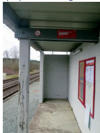
Intérieur de l'abri à la voie 2