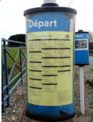
Les affiches jaunes sont encore présentées sur les anciennes valves cylindriques