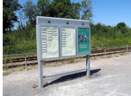
Panneau avec les horaires sur le quai 1