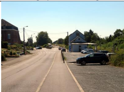
Parking à proximité de la gare