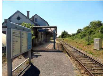
Vue du quai 2 en regardant vers Couvin