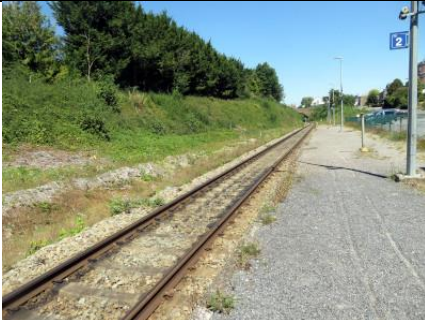
Vue du quai 2 en regardant vers Charleroi