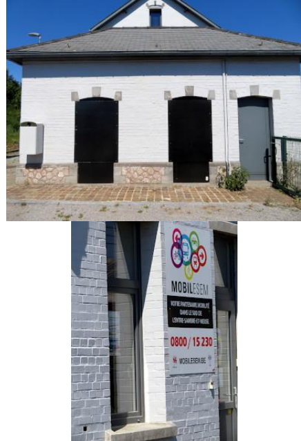
Le bâtiment abrite les locaux de l'asbl MOBILESEM