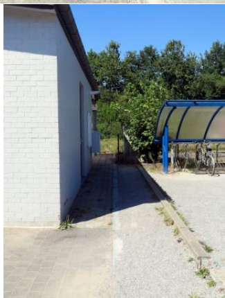
Accès à droite du bâtiment de gare