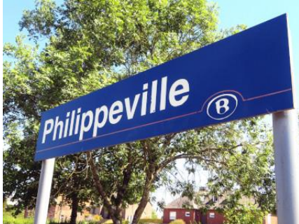
Philippeville, nous y sommes bien...