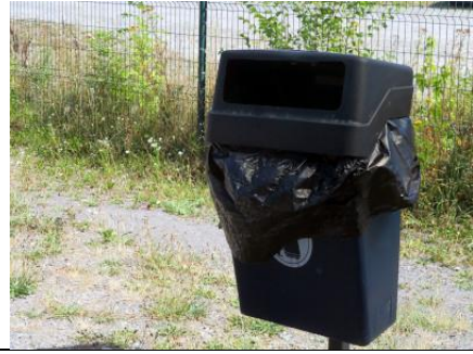
On trouve sur le quai des poubelles de l'ancien modèle