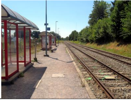
Vue du quai 1 en regardant vers Couvin