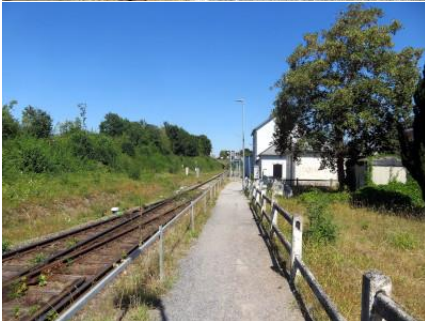
Le passage reliant les deux quais