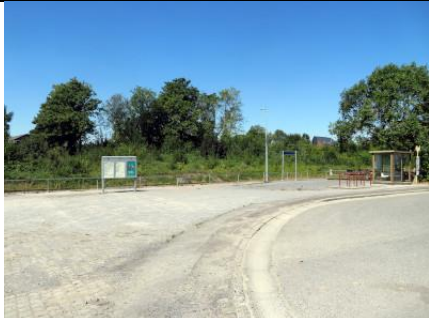
Accès au niveau du quai des trains vers Charleroi