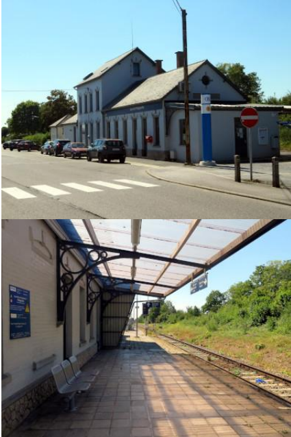
Sous la marquise à Philippeville...